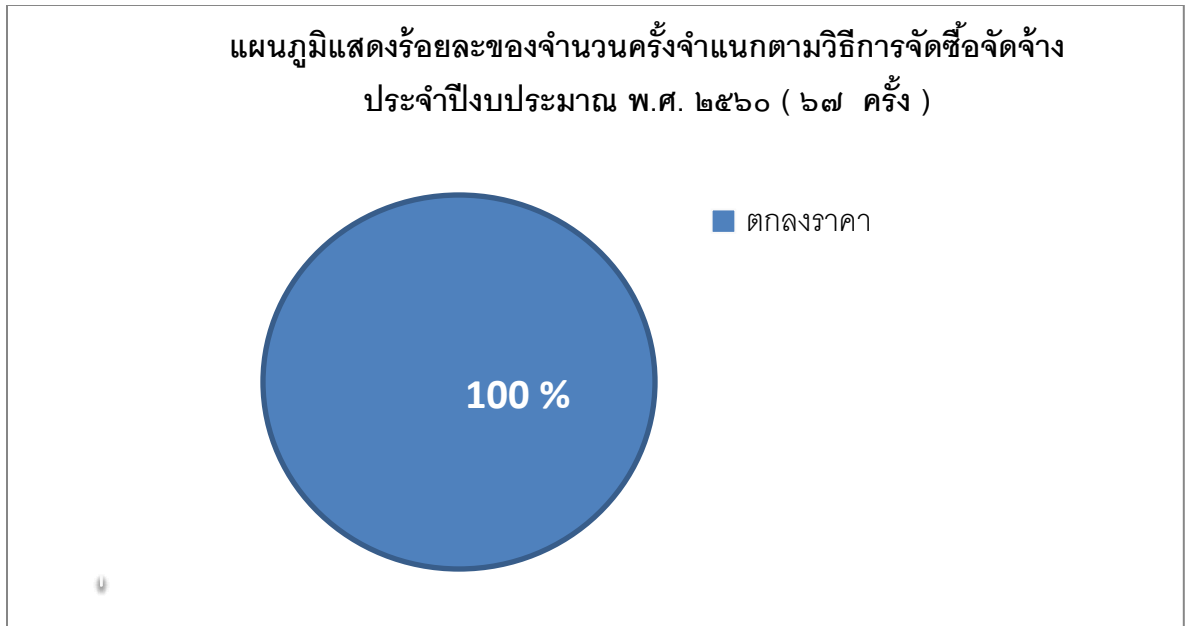
ตารางที่ ๒ แสดงร้อยละงบประมาณ จำแนกตามวิธีการจัดซื้อจัดจ้าง ประจำปีงบประมาณ พ.ศ. ๒๕๖๐